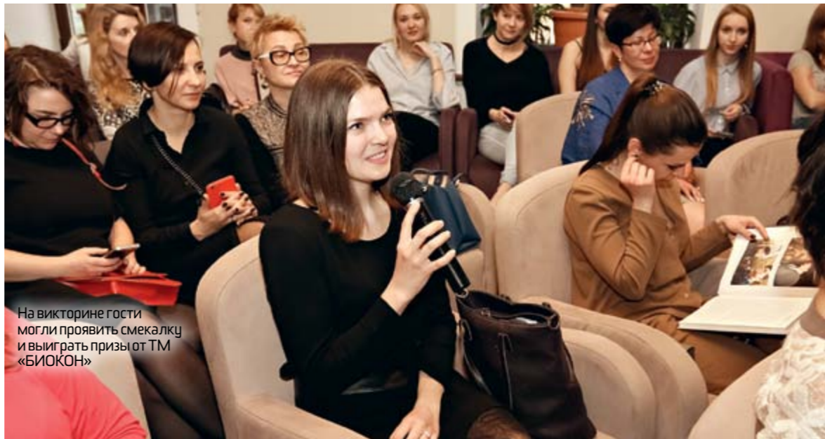
На викторине гости могли проявить смекалку и выиграть призы от ТМ «БИОКОН»

13 апреля в киевском ресторане Masha Sake прошла встреча Ольги Сумской с участницами проекта «Искусство быть красивой». Вечер, организованный журналом Viva! и брендом «БИОКОН», был посвящен теме, как эффективно сохранить свою природную красоту.